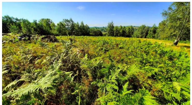
Feriga de câmp ( Pteridium aquilinum ) vedere aeriană și la sol

Monitorizarea realizată în perioada acestei luni s-a axat pe gândacul sihastru ( Osmoderma eremita ) în zona Costești – Cetățuie.