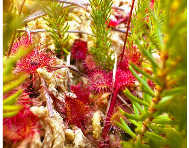
Roua cerului ( Drosera rotundifolia )