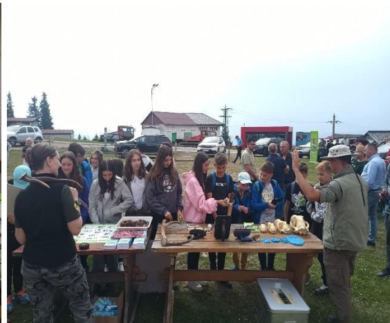
Activități de educație ecologică și conștientizare "Ziua Muntelui"

În data de 16.09.2023, cu ocazia Zilei de Curățenie Națională, în cadrul programului „Let's Do it, România!”, la convocarea Primăriei Comunei Orăștioara de Sus, echipa administrației parcului a participat la acțiunea de curățenie și strângere a gunoaielor în zona localității Grădiștea de Munte (Valea Grădiștei).