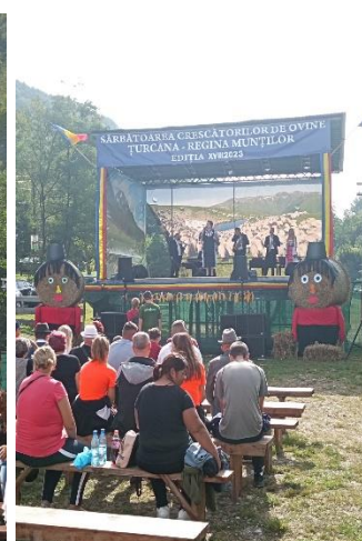
Sărbătoarea Crescătorilor de Ovine "Țurcana - Regina Munților", ediția a XVIII-a